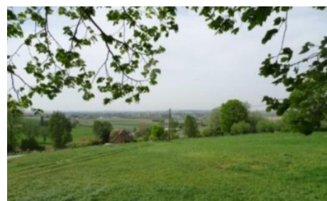
Het golvende Vlaamse land